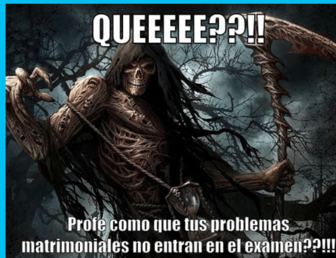
Imagen cómica con texto, que suele incluir escenas de películas o series.